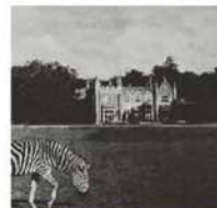
The Manour House av Tuija Lindström från 1983.