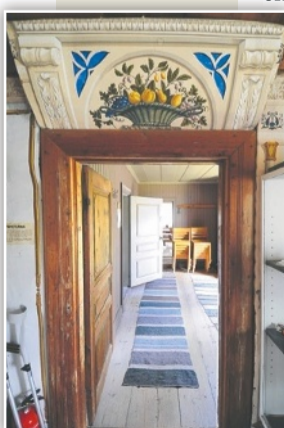
Även dörröverstycket är målat av Jonas Wallström.

ret på 1990-talet, sedan några år finns en ny serie ute.