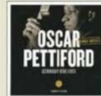
Oscar Pettiford Lost tapes Germany 1958 / 1959 Jazz Haus / Naxos

Oscar Pettiford, skicklig basist med enastående teknik och rytmisk harmonisk känsla i sitt spel, var en av de första som använde instrumentet som soloinstrument i större utsträckning. Kom till Tyskland för första gången 1958 då dessa inspelningar vid fem olika tillfällen gjordes med musiker boende i Europa.