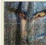
The Swallow Quintet Into the Woodwork XtraWATT/Naxos