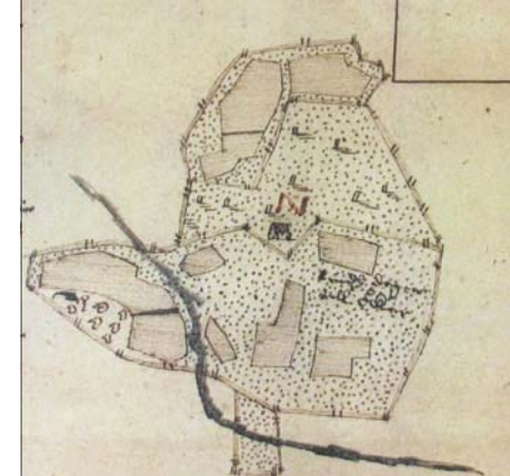
Svedåsen 1 år 1639